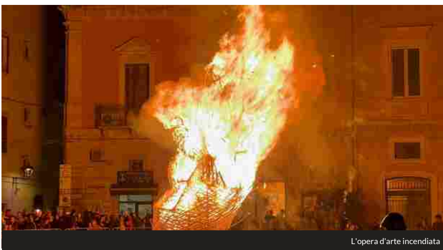
L'opera d'arte incendiata