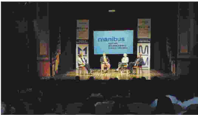
MANIBUS Due momenti delle iniziative svoltesi a Fasano tra teatro Sociale ed altre location: le esposizioni proseguono a Monopoli

Ritaglio stampa ad uso esclusivo del destinatario, non riproducibile.