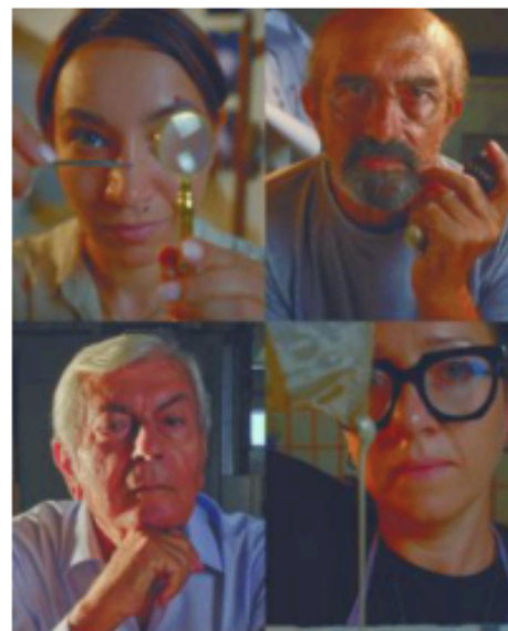
manibus FESTIVAL INTERNAZIONALE DI ARTE E IMPRESA

Con un programma ricco e variegato che fonda la sua progettualità nel dialogo tra maestria artigianale e capacità di visione propri dell'artista contemporaneo, il Festival avvia la sua programmazione il 26 settembre con MANIBUS Residenze d'Artista. In tale contesto quattro artisti, ospiti all'interno di prestigiose strutture ricettive, collaborano per tre settimane con altrettanti artigiani locali alla realizzazione di lavori che si traducono in corpi di pietra, elementi naturali tra leggerezza ed evanescenza, strutture di carta fatta a mano, lavori in ceramica, installazioni multidisciplinari e costruzioni ambientali di grandi dimensioni. Ciascuna opera è prodotta con tecniche e materiali diversi, retaggio di una terra di grande cultura artigiana e sapienza fabril. Il senso è quello di trasferirne l'essenza in opere d'arte inedite che rimangono permanentemente legate alla storia e al paesaggio del territorio pugliese.